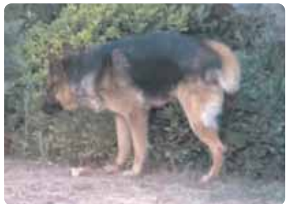
Figura 2 - Urinare con la zampa sollevata costituisce sia un segnale visivo che olfattivo.