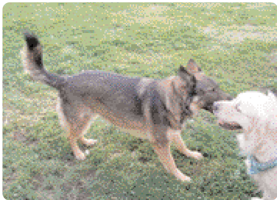
Figura 9 - Coda sopra la linea del dorso può indicare minaccia.

È importante ricordare che ci sono posizioni e tipi di portamento della coda che sono particolari di determinate razze e devono essere interpretate conoscendo bene l'aspetto normale della coda: per esempio i cani tipo spitz portano naturalmente la coda alta arrotolata sul dorso.