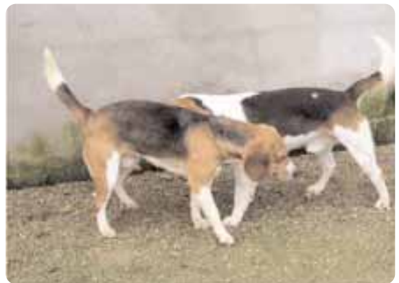
Figura 1 - Nel cane sono molto importanti i segnali olfattivi emessi da diverse ghiandole localizzate in varie parti del corpo.

Esistono anche dei segnali misti (olfattivi e visivi) quali urinare con la zampa sollevata (Fig. 2), marcare con le feci, raspare il terreno con rilascio delle secre-