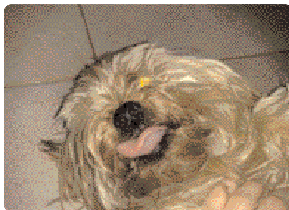
Figura 5 - Leccarsi le labbra può essere un segnale di stress e di paura.