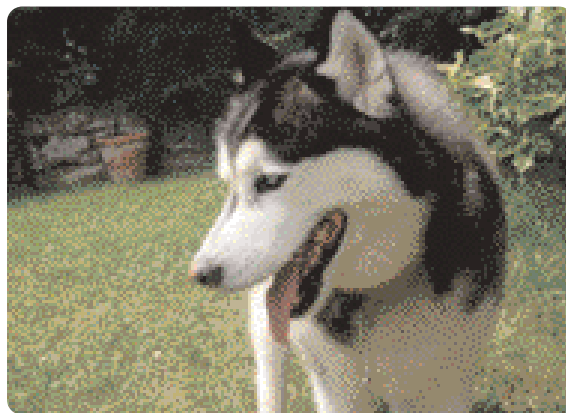
Figura 3 - Distogliere lo sguardo è un segnale che serve al cane per evitare di arrivare allo scontro fisico.

l'ultima possibilità. Alcune tra le posture che mirano ad evitare lo scontro sono: sembrare più piccoli, abbassare il collo e le orecchie, toccare con la zampa, leccare le labbra, distogliere lo sguardo (Fig. 3), esporre la regione inguinale (Fig. 4), scappare, acquattarsi, sedersi, mettersi in decubito laterale con un arto posteriore sollevato.