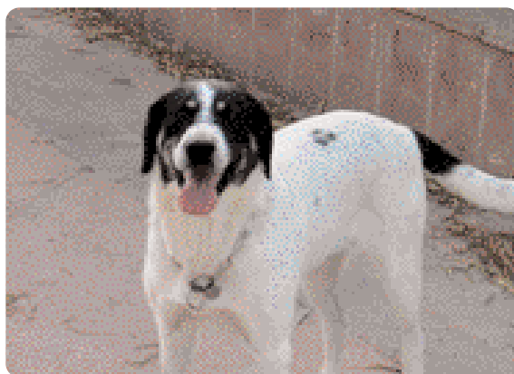
Figura 7 - Coda tenuta sotto la linea del dorso indica sottomissione.

Non si conosce ancora perfettamente il significato di questo segnale: è un comportamento complesso che riguarda sia la comunicazione olfattiva (agitando la coda, si diffondono nell'ambiente le secrezioni odorose emesse dalle ghiandole presenti a livello di regione anale e perianale) che visiva (il movimento della coda).