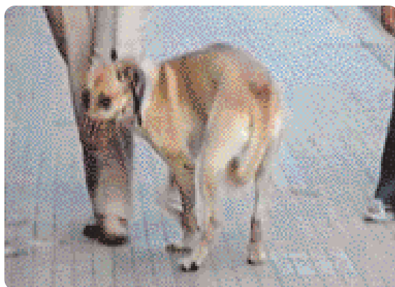
Figura 8 - Coda fra gli arti posteriori indica paura.